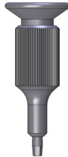
Handschaubendreher Inbus Art.-Nr. 46500