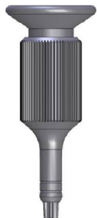
Handschaubendreher Torx Art.-Nr. 45100